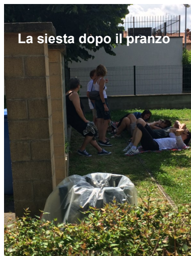
La siesta dopo il pranzo